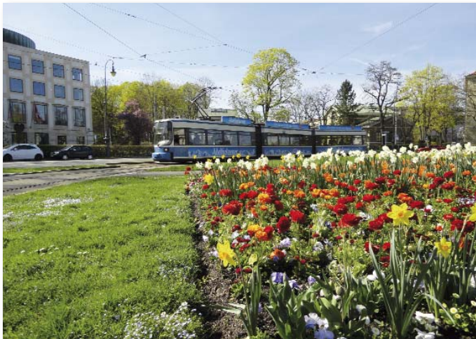
Karolinenplatz, links das Amerika Haus

Bayerns Verbraucherschutzministerin Dr. Beate Merk begrüßt die Initiative von Bundesministerin Ilse Aigner zur Honorarberatung und fordert die Europäische Kommission auf, jetzt die richtigen Weichen für den europäischen Anlegerschutz zu stellen.