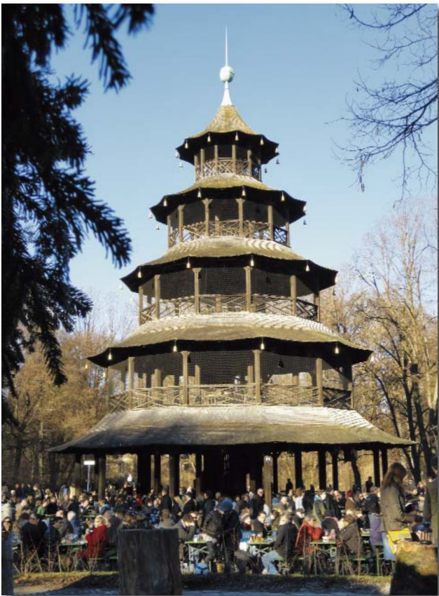
Chinesischer Turm, Englischer Garten

Entgegen der häufig anzutreffenden Ansicht gilt eine entsprechende Vergleichsberechnung nicht im umgekehrten Fall. Entschließt sich der Hauptbevollmächtigte, selbst zum Termin anzureisen, sieht er also von der Einschaltung eines Terminsvertreters ab, ist völlig unerheblich, wie hoch sich die Reisekosten belaufen. Auch wenn die anfallenden Reisekosten weit über 110 % der Mehrkosten eines Terminsvertreters liegen, sind sie erstattungsfähig (BGH WRP 2005, 1546 = GRUR 2005, 1072 = NJW-RR 2005, 1662 = Rpfleger 2006, 39 = AnwBl 2005, 792 = BGHReport 2006, 67 = MDR 2006, 296 = JurBüro 2006, 203 = BRAK-Mitt 2005, 279 = FA 2005, 373 = FamRZ 2005, 2062 = RVGreport 2005, 476 = NJW-Spezial 2006, 46 = GuT 2005, 261; BGH AGS 2008, 204 = WRP 2008, 363 = FamRZ 2008, 507 = AnwBl 2008, 215 = MDR 2008, 350 = Rpfleger 2008, 227 = BGHReport 2008, 363 = zfs 2008, 226 = JurBüro 2008, 258 = HFR 2008, 765 = NJW-RR 2008, 1378 = RVGreport 2008, 112 = GuT 2008, 55 = BRAK-Mitt 2008, 82).