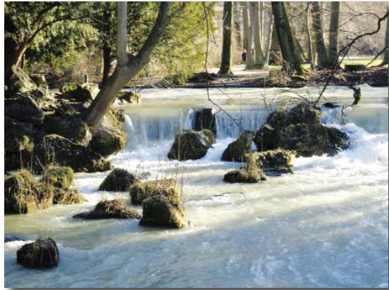
Eisbach, Englischer Garten

- Wird die Grenze dagegen überschritten, so sind nur die fiktiven Kosten des Hauptbevollmächtigten zu erstatten. Die Toleranzgrenze greift jetzt nicht etwa dergestalt, dass 110 % der Kosten eines Hauptbevollmächtigten zu erstatten wären (OLG Bamberg AGS 2007, 49 = OLGR 2006, 645 = JurBüro 2006, 541 = Rpfleger 2007, 47; OLG Oldenburg MDR 2008, 532 = AnwBl 2008, 381 = JurBüro 2008, 321 = OLGR 2008, 507 = Schaden-Praxis 2008, 378; OLG Brandenburg, Beschl. v. 21.8.2007 – 6 W 123/07).