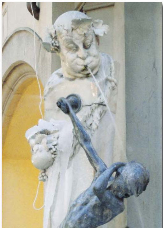
Brunnenbuberl, Neuhauser Straße

Mediatorin, Lehrbeauftragte Hochschule Landshut, Kanzlei Kastl (M.A.) & Kollegen, Landshut