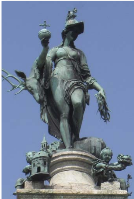
Dianatempel „Tellus Bavaria-Bronzestatue“

Das Gesetzbuch ist abrufbar auf einer Website des Föderalen Öffentlichen Dienstes Justiz unter http://www.just.fgov.be/ > Deutsch < Belgisches Staatsblatt < Belgisches Staatsblatt < Deutsch < Anderer Inhalt, Datum: 2011-09-15. (Quelle: Germany Trade & Invest, gtai-Rechtsnews 10/2011)