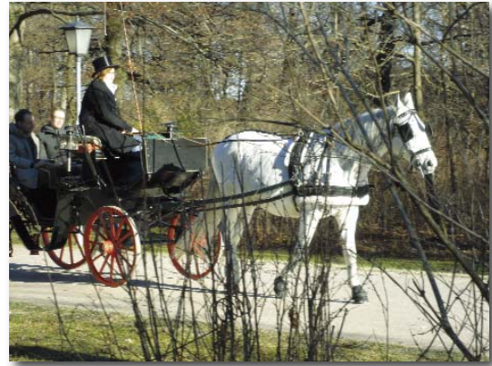
Fiaker, Englischer Garten

0,65-Verfahrensgebühr des Terminsvertreters die ersparten Reisekosten nicht übersteigt, sind diese Kosten daher erstattungsfähig, weil keine Mehrkosten i. S. d. § 92 Abs. 2 S. 2 ZPO ausgelöst werden.