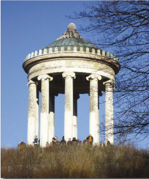
Monopteros, Englischer Garten

(Quelle: Pressemitteilung vom 25.10.2011 des Soldan Institut für Anwaltmanagement)