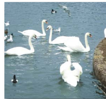
Schwäne, Kleinhesseloher See

Die Reisekosten des Prozessbevollmächtigten betragen netto insgesamt 131,00 €, also brutto 155,89 €.