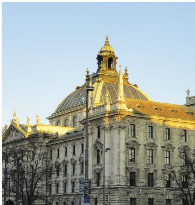
Justizpalast, Blick vom Stachus

Die äußere Aufmachung entspricht dem üblichen Design der Reihe NomosFormulare: glatter schwarz-blauer Hardcover-Einband mit gelber und weißer Schrift, passendes blaues Vorsatzpapier, etwas festeres, aber nicht zu dickes Papier im Buchblock, Fadenheftung. Also eine durchweg hochwertige Verarbeitung, die bei dem Preis des Werkes aber auch erwartet werden kann.