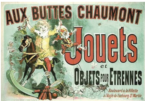
Jules Chéret | Aux Buttes Chaumont, Jouets et Objets pour Etranges, 1885 Farblithographie Les Arts Décoratifs, musée de la Publicité

Künstler der Belle Epoque und Pionier der Plakatkunst