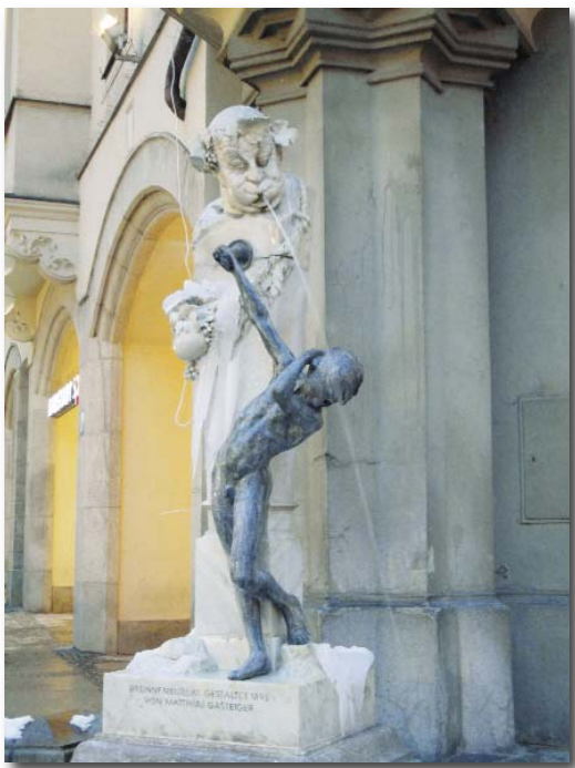
Brunnenbuberl, Neuhauser Straße

Mit dem Thema „Anwaltlicher Beistand in Betrieb und Handwerk“ hat sich letzten Donnerstag die im handwerk magazin erschienene Anzeige ( anwaltverein.de/downloads/Depescheninhalte/150dpiDAVBautrupp210x136HandwMag39L2.pdf ) im Rahmen der DAV-Imagewerbung beschäftigt. Sie zeigt eine Anwältin im Kreise von Bauarbeitern und Handwerkern auf einer Baustelle. Die Aussage dazu „Keine Ahnung vom Zementmischen, aber unerlässlich auf dem Bau.“ Dahinter steht der Gedanke, dass große und kleine Unternehmen nicht nur in Streitfällen auf anwaltliche Beratung zurückgreifen sollten.