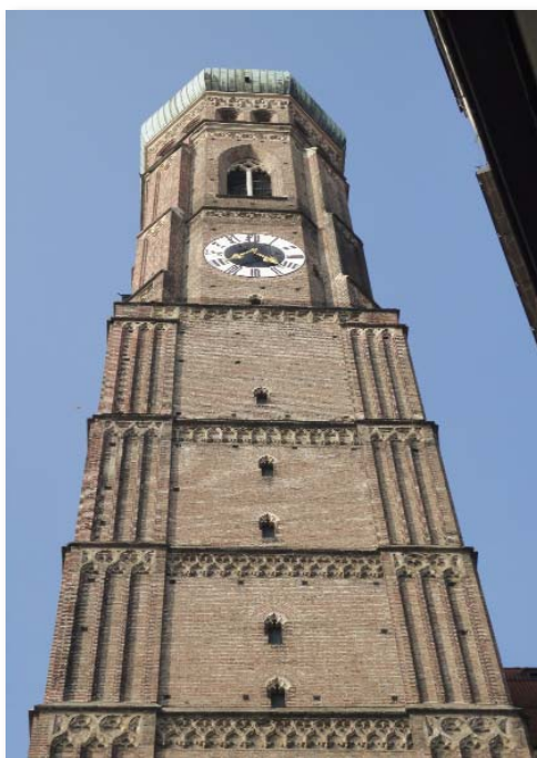
Turm der Frauenkirche

vorgelegt. Diese weitere Stellungnahme ergänzt die vorhergehenden DAV-Stellungnahmen Nr. 64/10 vom 13. Oktober 2010, Nr. 16/11 vom 29. März 2011 und Nr. 32/11 vom 31. Mai 2011 zu dem Gesetzesvorhaben. Der DAV möchte mit dieser Stellungnahme angesichts zahlreicher kritischer Äußerungen von Verbänden, Vereinen, Interessenvertretern und in der insolvenzrechtlichen Literatur zum Regierungsentwurf seine eigene Position nochmals verdeutlichen und insbesondere Lösungsmöglichkeiten für die angesprochenen Probleme bei der Verwalterbestellung (§§ 22a, 56 InsO) aufzeigen. Problematisch wird die Eignung eines vorgeschlagenen Insolvenzverwalters nach diesen Gesetzesvorschlägen insbesondere dann, wenn er den Schuldner vor dem Eröffnungsantrag über den Ablauf eines Insolvenzverfahrens und dessen Folgen beraten hat. In einer Reihe von Fallkonstellationen kann es insoweit zu erheblichen Interessenkollisionen im Hinblick auf die unterschiedlichen Gläubigergruppen kommen. Die Vorschrift sollte deshalb enger gefasst werden. Die ergänzende Stellungnahme Nr. 55/11 vom 22. September 2011 finden Sie unter www.anwaltverein.de/downloads/Stellungnahmen-11/SN55InsOESUG.pdf .