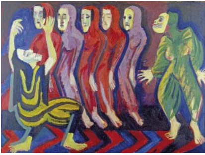
Ernst Ludwig Kirchner: Totentanz der Mary Wigman, 1926/1928, Öl auf Leinwand, Galerie Henze & Ketterer Wichtrach/Bern