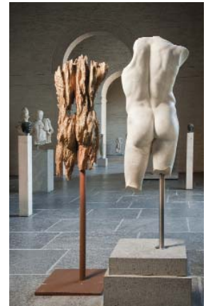
Torso männlich, Foto: Renate Kühling © Staatliche Antikensammlungen und Glyptothek

Die emotional aufgeladenen Holzskulpturen des Bildhauers Andreas Kuhnlein aus Unterwössen treten in einen spannungsreichen Dialog mit dem Weltkulturerbe antiker Skulpturen in der Glyptothek. Sie fordern uns in ihren offensichtlichen Verwundungen der Oberfläche und teils brachialen Eingriffen in die körperliche Disposition dazu auf, das Menschenbild angesichts historischer Vergänglichkeit intensiv zu bedenken. Gibt es einen verbindenden Kern, der die Jahrtausende verklammert? Oder sind vielmehr wir, die Gegenwärtigen, gefragt, unsere Bedingtheit in einem fernen Spiegel mit Hilfe der künstlerischen Verstärkung des Zeitgenossen zu reflektieren?" (Text: Jochen Meister)