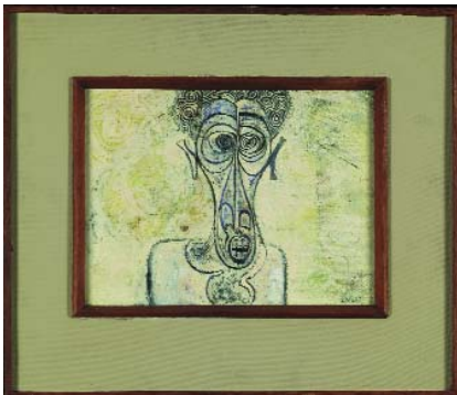
Ibrahim El-Salahi Self-Portrait of Suffering, 1961, Oil on canvas, 30,4 x 40,6 cm, Iwalewa-Haus, University of Bayreuth, Germany

Donnerstag, 24.11.2016, um 18.00 Uhr: Haus der Kunst, Führung mit Jochen Meister