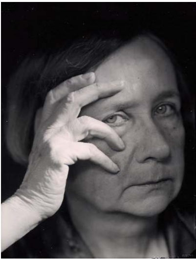
Gabriele Münter | Porträt, um 1935