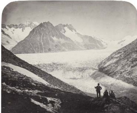
Adolphe Braun | Aletsch-Gletscher in den Berner Alpen Albuminpapier, um 1870 © Münchner Stadtmuseum

Samstag, 21. Oktober 2017, um 11.00 Uhr, Münchner Stadtmuseum Führung mit Dr. Ulrike Kvech-Hoppe