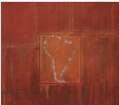
Frank Bowling | South America Squared, 1967 Acrylic on canvas, 243 x 274 cm, 95 5/8 x 107 7/8 in Rennie Collection, Vancouver, © VG Bild-Kunst, Bonn 2017