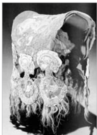
Satteldecke mit applizierten Tierstilornamenten aus Kurgan 1 von Pazyryk 4. bis 3. Jahrhundert v. Chr. 119 x 60 cm