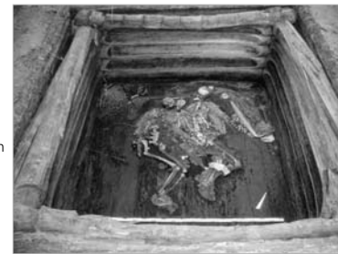
Blick in die Holzkammer von Grab 5 im Kurgan Arzan 2 mit der Bestattung des Fürstenpaares 7. Jahrhundert v. Christus Dm. 3,3 x 3,6 m