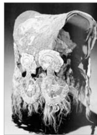
Satteldecke mit applizierten Tierstilornamenten aus Kurgan 1 von Pazyryk 4. bis 3. Jahrhundert v. Chr. 119 x 60 cm