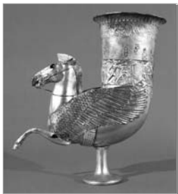
Trinkhorn in Form eines Pegasus aus dem im Kubangebiet gelegenen Kurgan 4 von Uljap 4. Jahrhundert v. Christus Höhe 37 cm © Staatliches Museum des Ostens Moskau

Neben den archäologischen Hinterlassenschaften der Skythen werden in diesem groß angelegten Projekt auch Ergebnisse moderner Ausgrabungstechnik, sowie naturwissenschaftlicher und anthropologischer Untersuchungen vorgestellt. Die sensationellen Erkenntnisse dieser Forschungen ermöglichen in dieser Ausstellung nicht nur die faszinierende Grabarchitektur und ihre goldenen Schätze kennen- zulernen, sondern durch einen Blick auf die Umweltbedingungen in den Steppen-regionen und daraus abgeleitet auf Ernährungsgewohnheiten, Krankheiten und Verwandtschaftsbeziehungen erstmals ein umfassendes Bild der Skythen zu gewinnen, die uns als schriftlose Kultur bislang in vieler Hinsicht verborgen war. (Quelle: Pressemitteilung der Kunsthalle der Hypo Kulturstiftung, Bilder mit freundlicher Genehmigung d. Pressestelle)